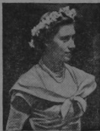
Princess Margaret came of age on August 21st, and celebrated her birthday at Balmoral Castle.